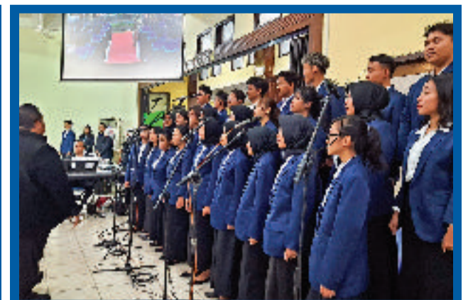
Paduan Suara Sapta Gita Jaya pada saat Wisuda Ke-65 USM