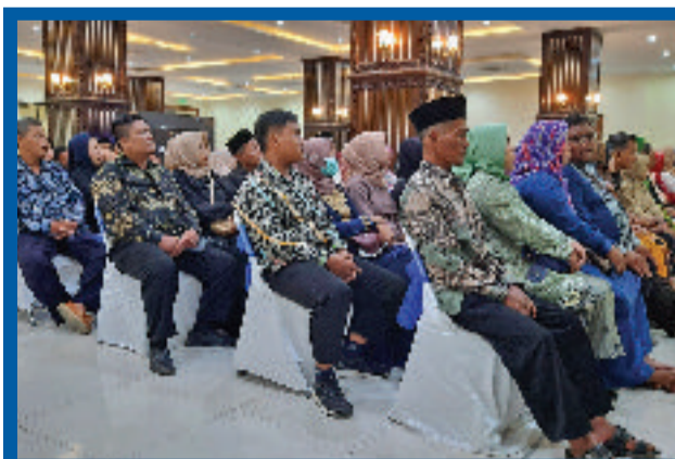
Tamu/Orang tua/pengantar para peserta Wisuda Ke-65 USM