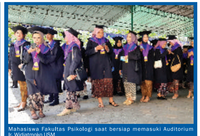
Mahasiswa Fakultas Psikologi saat bersiap memasuki Auditorium Ir. Widjtmoko USM