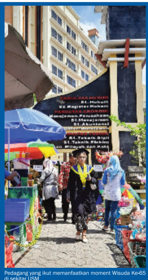
Pedagang yang ikut memanfaatkan moment Wisuda Ke-65 di sekitar USM