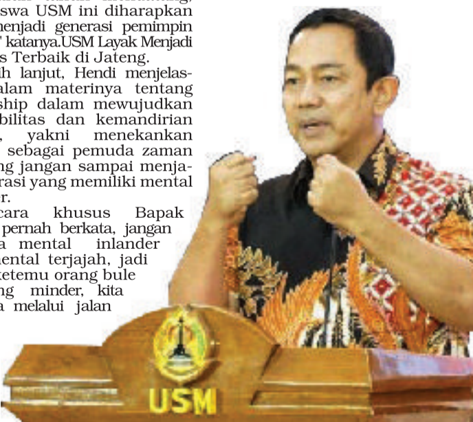
Kepala Lembaga Kebijakan Pengadaan Barang atau Jasa (LKPP), Dr Hendrar Prihadi SE MM, pada acara kuliah umum di USM

Selanjutnya, Hendi mengatakan sebagai generasi muda saat ini harus menjunjung tinggi kebenaran dan tidak malu untuk meminta maaf jika melakukan hal yang salah atau keliru. (*)