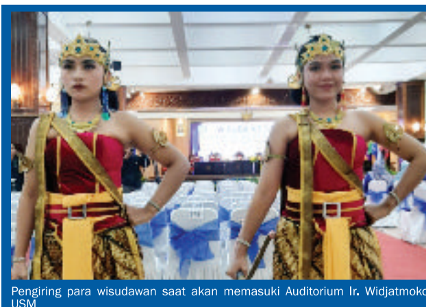
Pengiring para wisudawan saat akan memasuki Auditorium Ir. Widjtmoko USM