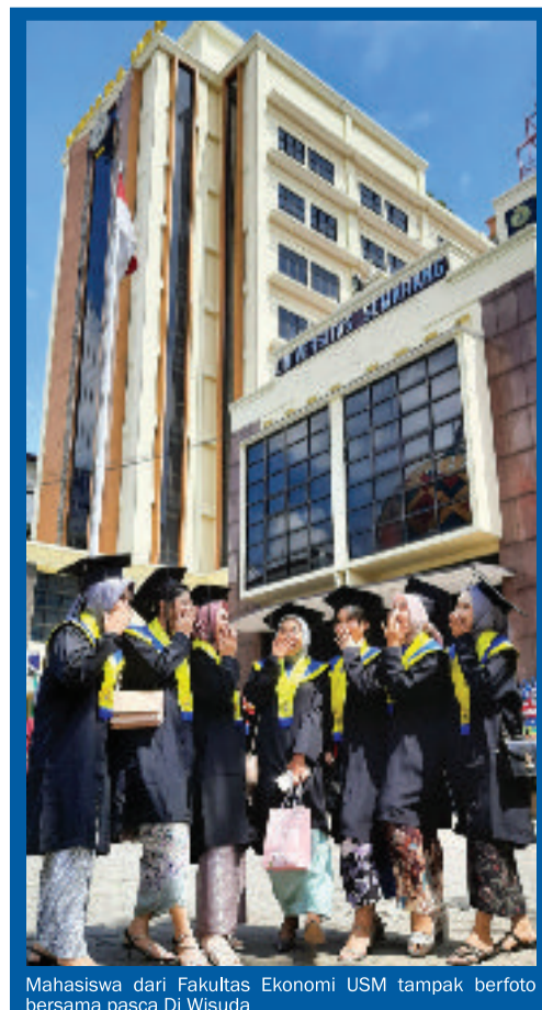
Mahasiswa dari Fakultas Ekonomi USM tampak berfoto bersama pasca Di Wisuda