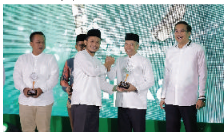
Lifetime Achievement HIPKA JATENG

"Kami mengimbau kepada seluruh anggota Hipka agar senantiasa menyisihkan rezeki untuk zakat, infak, sedekah (ZIS). Karena kita bicara ekonomi, pasti ada 2,5 persen yang diperuntukkan fakir miskin. Artinya, untuk penanggulangan kemiskinan. Tidak hanya maju sendiri, akan tetapi maju bersama-sama. Ini yang diharapkan dari pemerintah, baik Jawa Tengah maupun pusat, dan itu juga yang diamanatkan oleh agama kita," ungkapnya. (*)