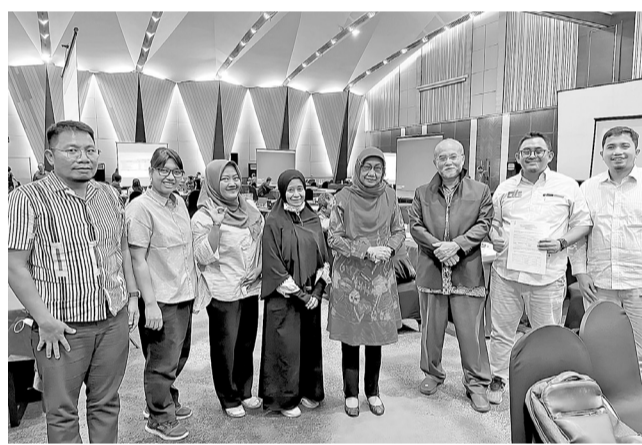
Tim Program Kompetisi Kampus Merdeka (PK-KM) Universitas Semarang (USM)