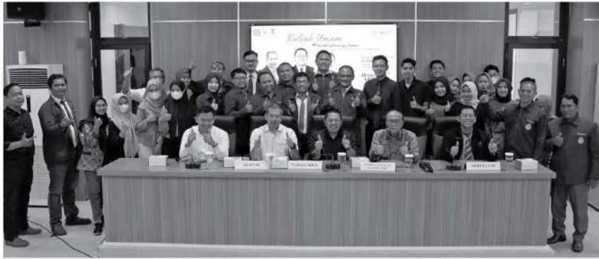
Foto bersama usai Kuliah Umum Bersama Kepala Pusat Penerangan Hukum Kejaksaan Agung yang di selenggarakan Magister Hukum USM