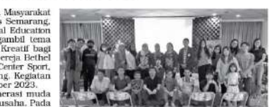
Foto bersama usai Gelar Pemahaman Ekonomi Kreatif Bagi Generasi Milenial oleh Tim PKM Fak. Ekonomi USM

berkurang. Guna mengantisipasi kelangkaan (scarcity) sumber daya tersebut, maka diperlukan kreatifitas dari para pelaku ekonomi sehingga akan dihasilkan produk yang berkualitas dan dapat langsung dikonsumsi oleh end user. Ciri The Creativity of Economy adalah bahwa produk atau jasa yang dihasilkan mudah ditiru dan tidak bertahan lama. Kegiatan ini diisi dengan paparan materi dasar tentang ekonomi kreatif bagi generasi muda yang kemudian dilanjutkan dengan diskusi dari para peserta. (*)