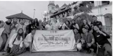
Susunan saat kegiatan Kultur Camp yang di selenggarakan oleh Internasional Office Universitas Semarang

sering terjadi pada siswa yang mengakibatkan terjeranya penyimpangan perilaku sosial dan mengalami gangguan mental. Oleh karena itu, peningkatan perilaku asertif diperlukan agar mereka dapat terhindar dari berbagai bentuk kenakalan remaja.