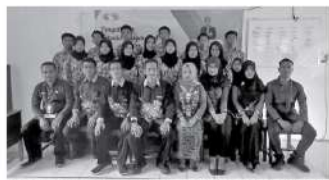
Foto bersama Dosen FTP USM usai Berikan Sosialisasi Ke Siswa SMK Negeri 1 Kedung Jepara

JEPARA - Dosen Jurusan Teknologi Hasil Pertanian (THP-FTP) Universitas Semarang (USM) menggelar Sosialisasi Peranan Teknologi Pengolahan Daging Dalam Mempertahankan Mutu dan Keamanan Pangan di SMK Negeri 1 Kedung Jepara pada Kamis 02 November 2023.