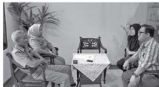
Kerjasama Penyelenggaraan Tridharma Perguruan Tinggi dan Program MBKM antara FTIK USM dengan Dinas Pariwisata Kota Semarang

Diharapkan dengan kegiatan tersebut, para siswa-siswi dan para guru SMK NU Hasyim Asyari Tegal dapat meningkatkan pengetahuan tentang fiber optik yang kedepannya mereka dapat mengimplementasikan dan memberikan pengetahuan layouting kabel multicore pada fiber di dunia kerja secara langsung nanti. (*)